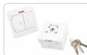
Przełączniki klawiszowe i kluczykowe