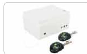
Centralki z pilotami