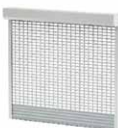
BKR / SK