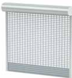
BKR / SKO-P