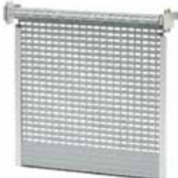
BKR / KNB