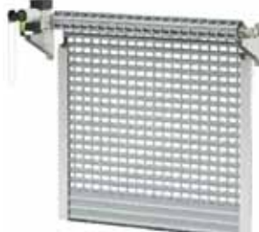
BKR / KNS